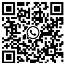
Spiel- und Bastelnachmittag WhatsApp-Gruppe