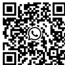
Freaky Friday WhatsApp-Gruppe