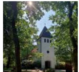
Kirche im Morgenlicht