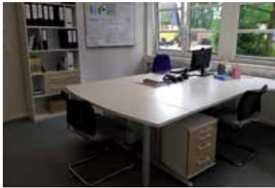
Neues Büro im Gemeindehaus... endlich!