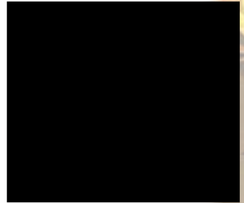
Ausflug zum Boxberg