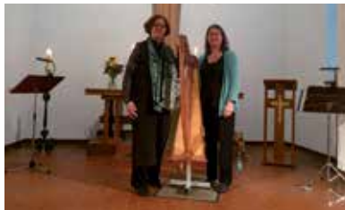
Konzert „Lieder und Harfenklänge zur Sommerzeit“