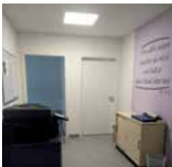
Flur mit Vers an der Wand