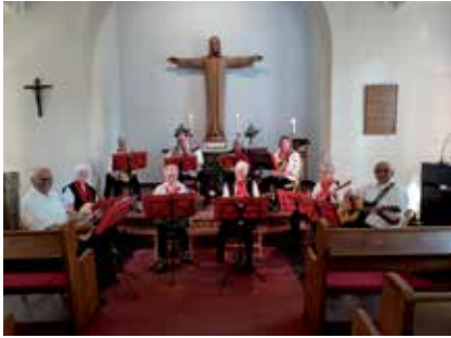
Konzert der Mandolinengruppe aus Einfeld